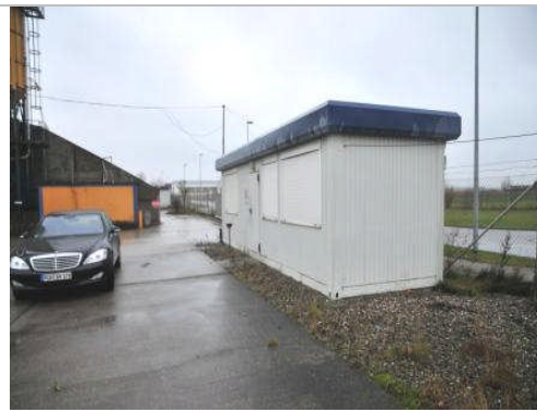
Steuerung Litronic II Liebherr ohne Container