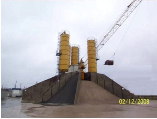
Stern mit 5 Boxen