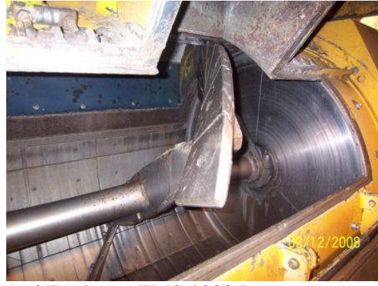
1m 3 Festbeton EMS 1000 B