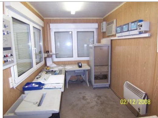
Steuerung Container von innen