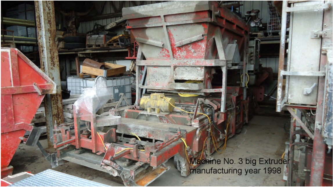
Machine No. 3 big Extruder manufacturing year 1998