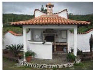
Grill/Bar im spanischen Stil

Familienfreundlich, Haustiere erlaubt, Hunde erlaubt, Nichtraucherobjekt, rollstuhlgerecht, seniorengerecht, Überwinterungsurlaub