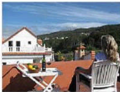
Blick auf Villa und Teide