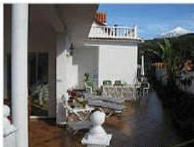
Sonnterrasse mit Teideblick

Die Ferienwohnungen wurden renoviert, die großzügigen Terrassen neu angelegt und sauber gefliest. Raumböden verglaste Schiebetüren/Fenster schaffen eine Wohlfühlumgebung in den lichtdurchfluteten Innenräumen.