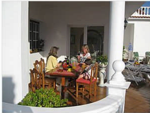
Überdachte Terrasse mit großem Esstisch