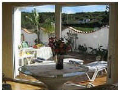
Wintergarten und Terrasse

Einsame Strände, üppig grüne Naturschutzgebiete im Norden, die sehr gepflegte Stadt Puerto de la Cruz, das pulsierende Touristenleben im Süden uva.